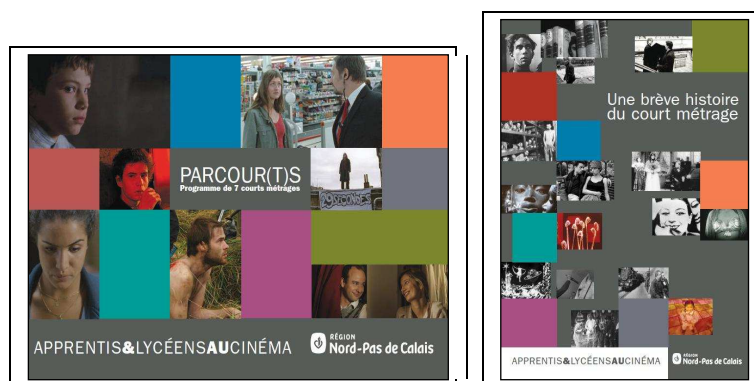
Le livret enseignant Parcour(t)s (36 pages) et la fiche élève Une brève histoire du court métrage (4 pages)

Comme chaque année, l'impression des documents pédagogiques a été prise en charge par la Région Nord-Pas de Calais , grâce aux services de la Direction de la Communication.